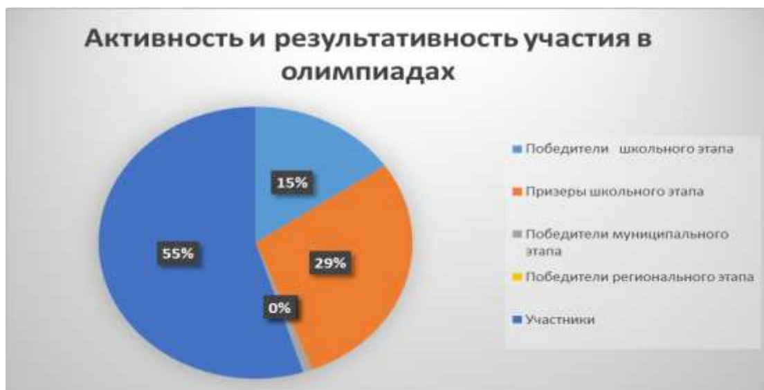
Диаграмма по результатам участия школьников во ВсОШ

- 1 призер муниципального этапа олимпиады «Юниор» (2 место).